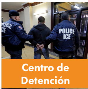
Centro de Detención