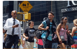
خیابان یا مناطق عمومی