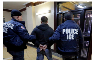
مركز احتجاز المهاجرين