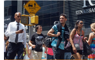
خیابان یا مناطق عمومی