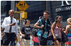
街道 / 公共场所